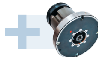
1 adaptateur d'équilibrage standard HSK-A63 inclus (Référence 80.201.A63.00) 1 standard balancing adapter HSK-A63 included (Order No. 80.201.A63.00)